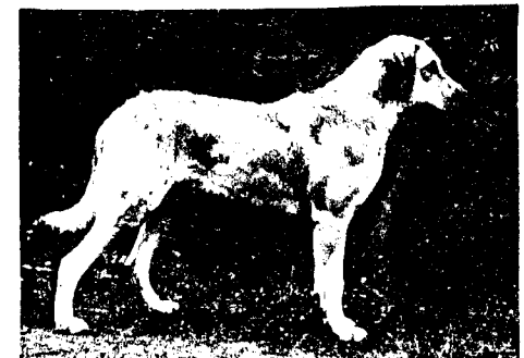
Vuonna 1979 narttu V-81 Eastern Waters' Winnepesaukee Suomesta Tuom. Dan Horn, USA