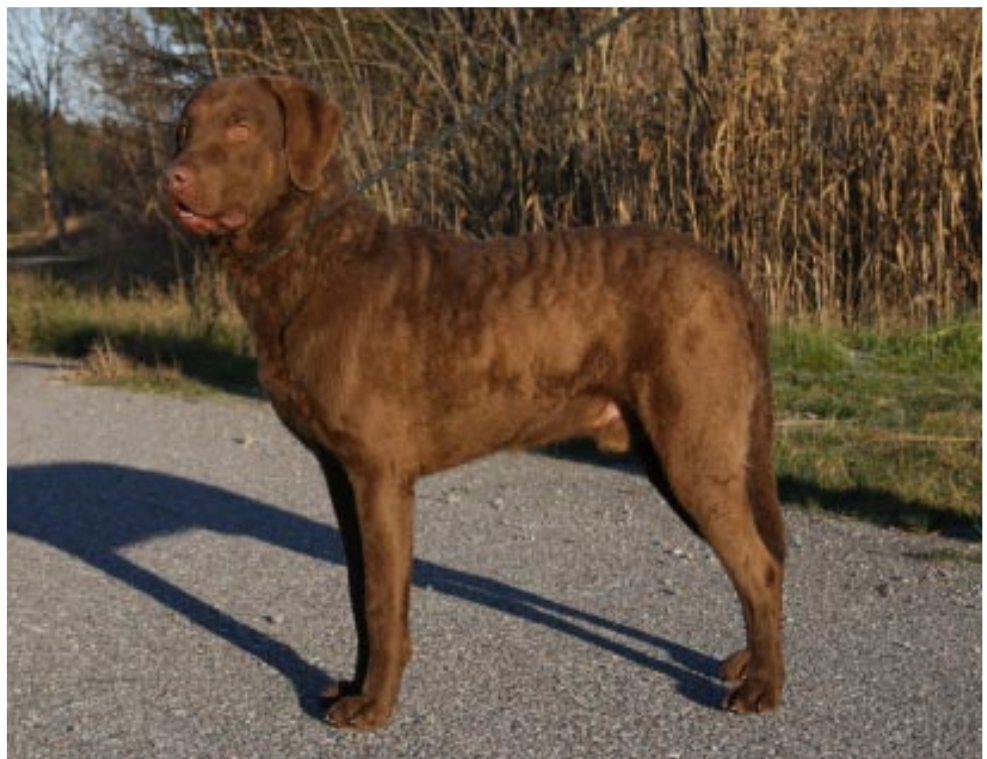
Vuoden 2005 aktiivisin chessie Batzi's Arnac Merlin